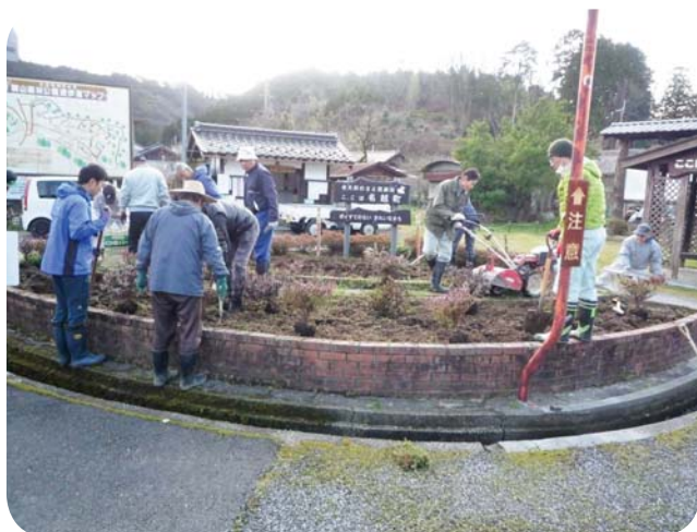
湖北地区／長浜市名越町（サツキの植栽）