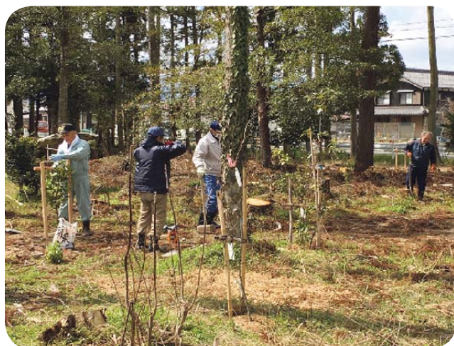
高島地区／高島市新旭町深溝（ヤブツバキ等の植栽）