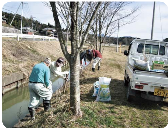
甲賀地区／甲賀市甲賀町神保（アジサイの植栽）