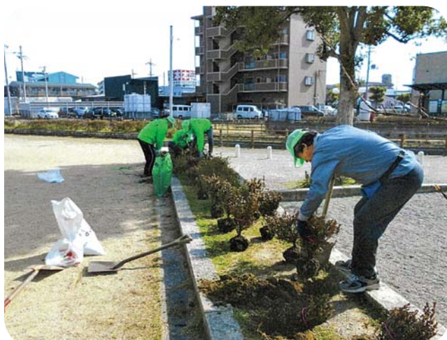
東近江地区／近江八幡市鷹飼町（サツキの植栽）