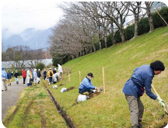
西部・南部地区／大津市仰木の里（シダレザクラの植栽）

生活環境を一層潤いのあるものにするため、市町緑化推進委員会の計画に基づき、公園や地域の広場、街路、公共施設等に地域住民の協働による緑化樹の植栽を行いました。